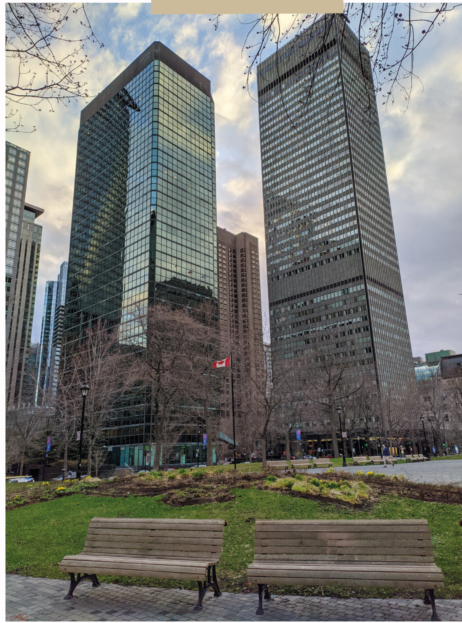
Place du Canada