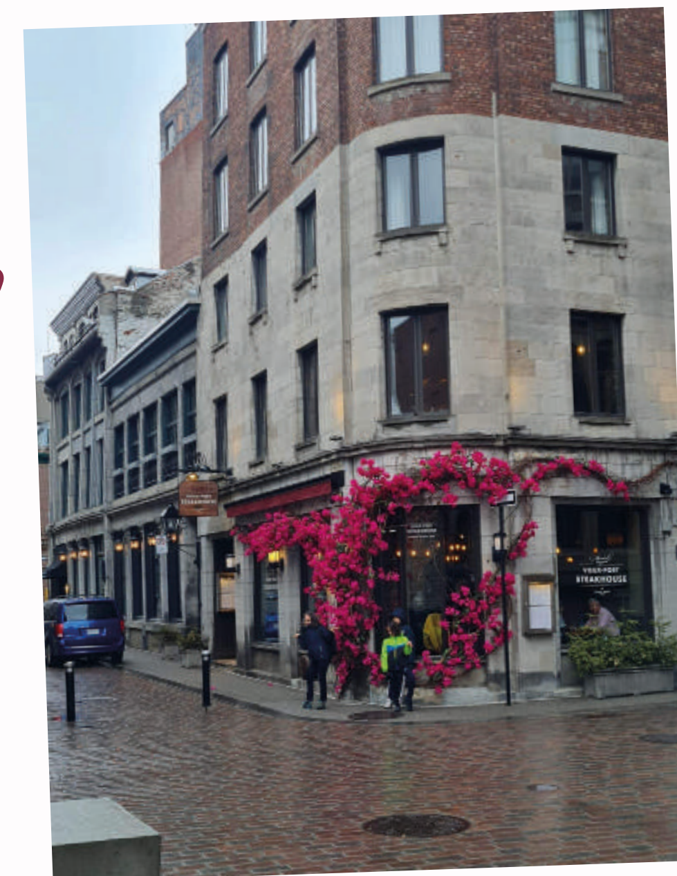
♥ Rue Guy