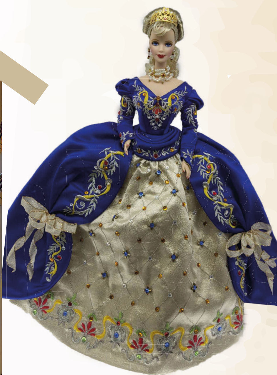
Ville souterraine de Montréal