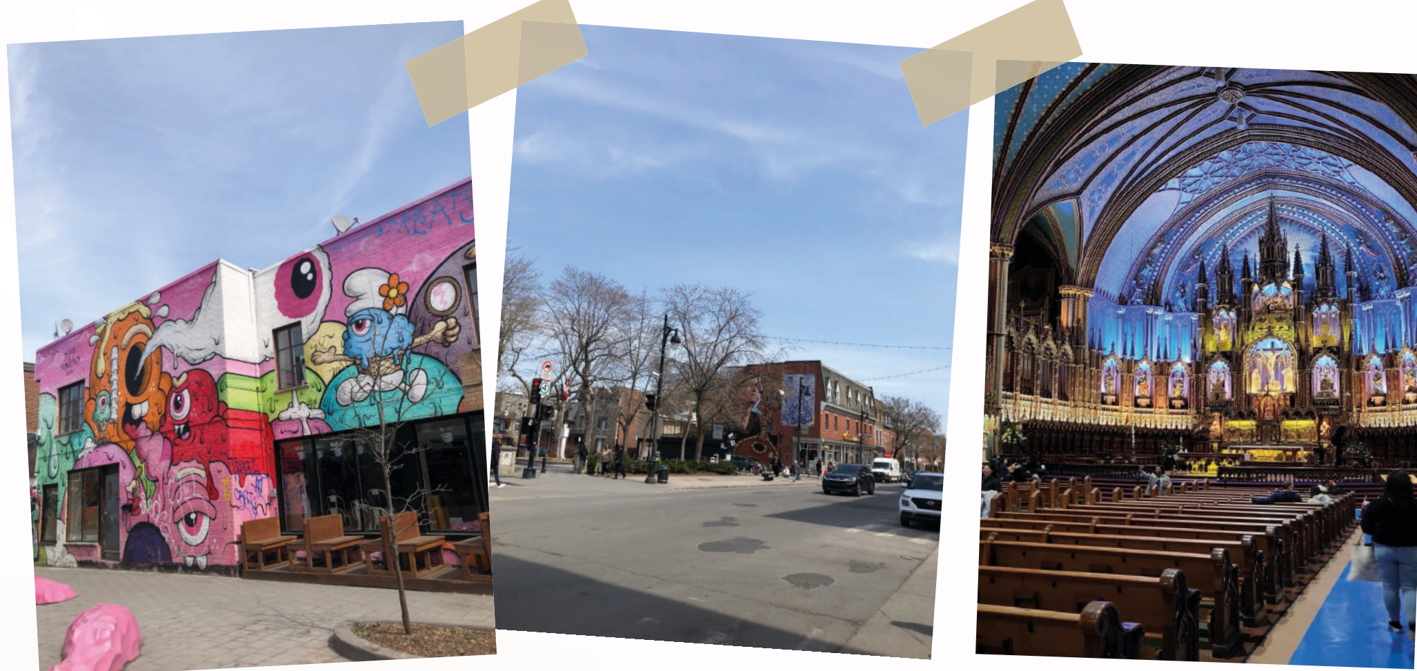
♥ Quartier Mont Royal

C'est pour sûr avec ces images que nous profitons des dernières heures au soleil pour visiter les derniers monuments et quartiers branchés. Certains choisissent de s'enfermer dans des expositions, d'autres dans la célèbre basilique Notre-Dame de Montréal quand enfin d'autres se promènent à la recherche de souvenirs pour leurs proches.