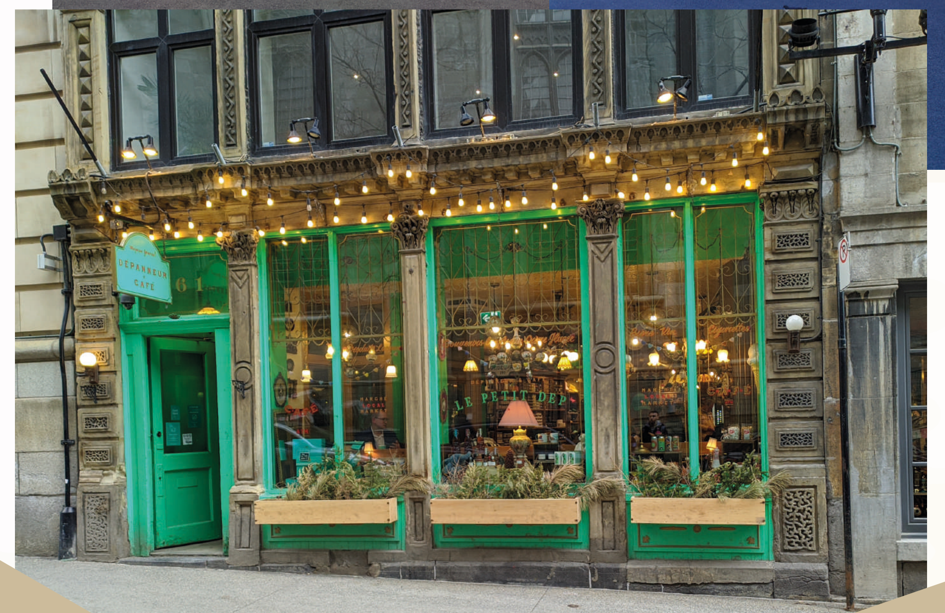
♥ Dépanneur Capé